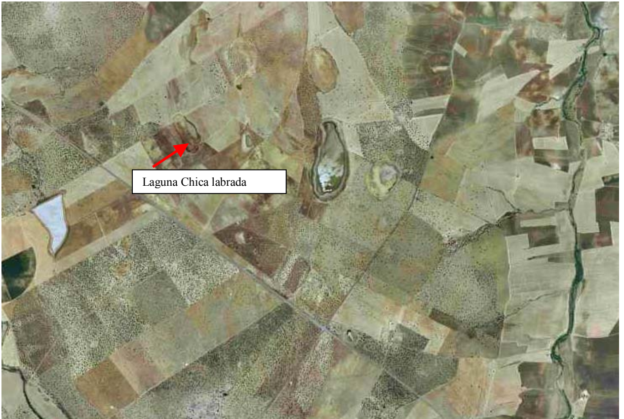
Foto aérea del Complejo Lagunar en 2002 Se observa la poca capacidad de llenado de las lagunas y la afección de los cultivos de secano. Algunas lagunas se encuentran labradas.