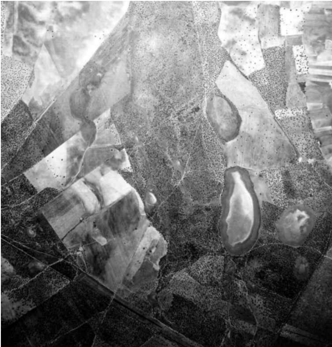
Foto aérea del Complejo Lagunar en 1973. Desaparece parte del bosque de encinas y matorral