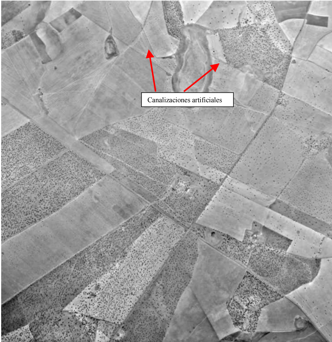
Foto aérea del Complejo Lagunar en 1987 Se observan ya las canalizaciones con objeto de desecación de las lagunas para incrementar las zonas de cultivo.