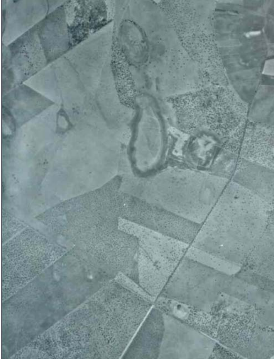
Foto aérea del Complejo Lagunar en 1983 Ha desaparecido gran parte de los bosques de encinas y matorral, especialmente en torno a las Lagunas del Junco, Grande, Llana y Chica.