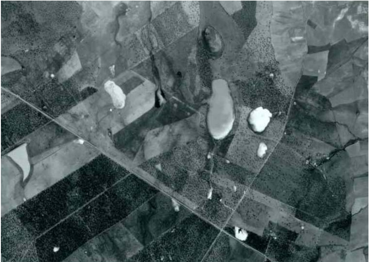
Foto aérea del Complejo Lagunar en 1997 Año de mucha pluviometría. Se pueden detectar las lagunas y las zonas naturales de escorrentía.